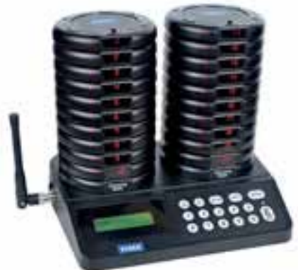
All-in-one Gasten oproepsysteem

De investering in het gasten oproep systeem hangt af van de grootte van uw vestiging, het aantal verdiepingen en de aanwezigheid van een terras.