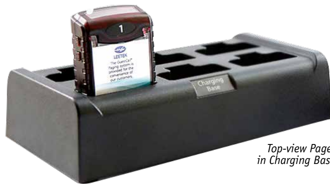
Top-view Pager in Charging Base